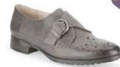
Busby Jazz Dark Grey Leather £69.99 Womens Casual Shoes