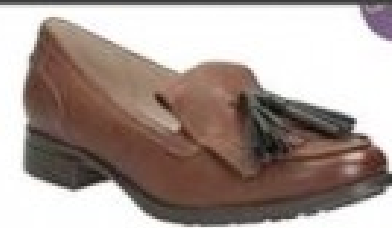
Busby Folly Dark Tan Leather £69.99 Womens Casual Shoes