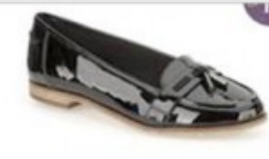
Angelica Crush Black Patent £44.99 Womens Smart Shoes