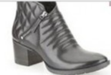
Movie Retro Black Leather £89.99 Womens Casual Boots