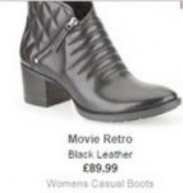
Movie Retro Black Leather £89.99 Womens Casual Boots