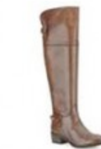
Lindley Charm Tan Leather £160.00 Womens Smart Boots