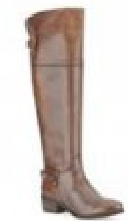
Lindley Charm Tan Leather £160.00 Womens Smart Boots