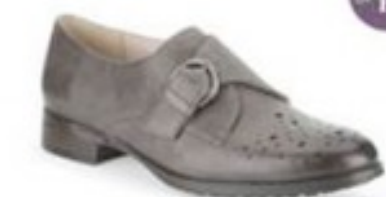
Busby Jazz Dark Grey Leather £69.99 Womens Casual Shoes