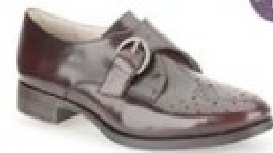
Busby Jazz Ox-Blood Leather £69.99 Womens Casual Shoes