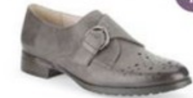
Busby Jazz Dark Grey Leather £69.99 Womens Casual Shoes