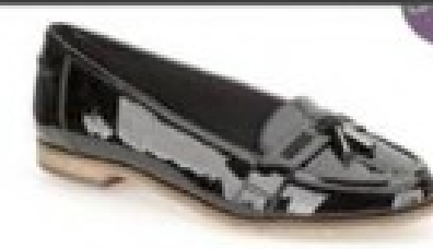
Angelica Crush Black Patent £44.99 Womens Smart Shoes