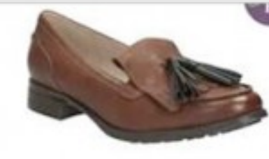
Busby Folly Dark Tan Leather £69.99 Womens Casual Shoes