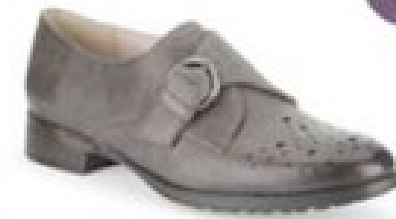
Busby Jazz Dark Grey Leather £69.99 Womens Casual Shoes