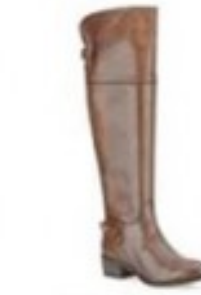
Lindley Charm Tan Leather £160.00 Womens Smart Boots