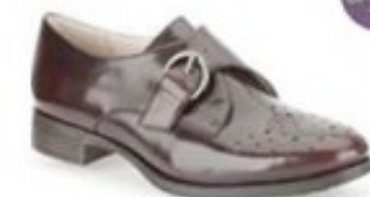
Busby Jazz Ox-Blood Leather £69.99 Womens Casual Shoes