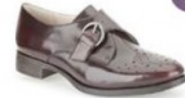
Busby Jazz Ox-Blood Leather £69.99 Womens Casual Shoes