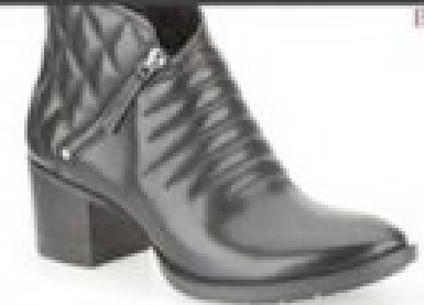
Movie Retro Black Leather £89.99 Womens Casual Boots