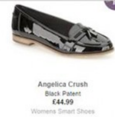
Angelica Crush Black Patent £44.99 Womens Smart Shoes