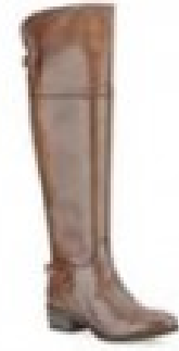
Lindley Charm Tan Leather £160.00 Womens Smart Boots