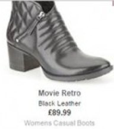
Movie Retro Black Leather £89.99 Womens Casual Boots