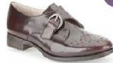
Busby Jazz Ox-Blood Leather £69.99 Womens Casual Shoes