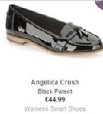
Angelica Crush Black Patent £44.99 Womens Smart Shoes