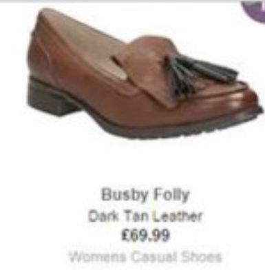
Busby Folly Dark Tan Leather £69.99 Womens Casual Shoes