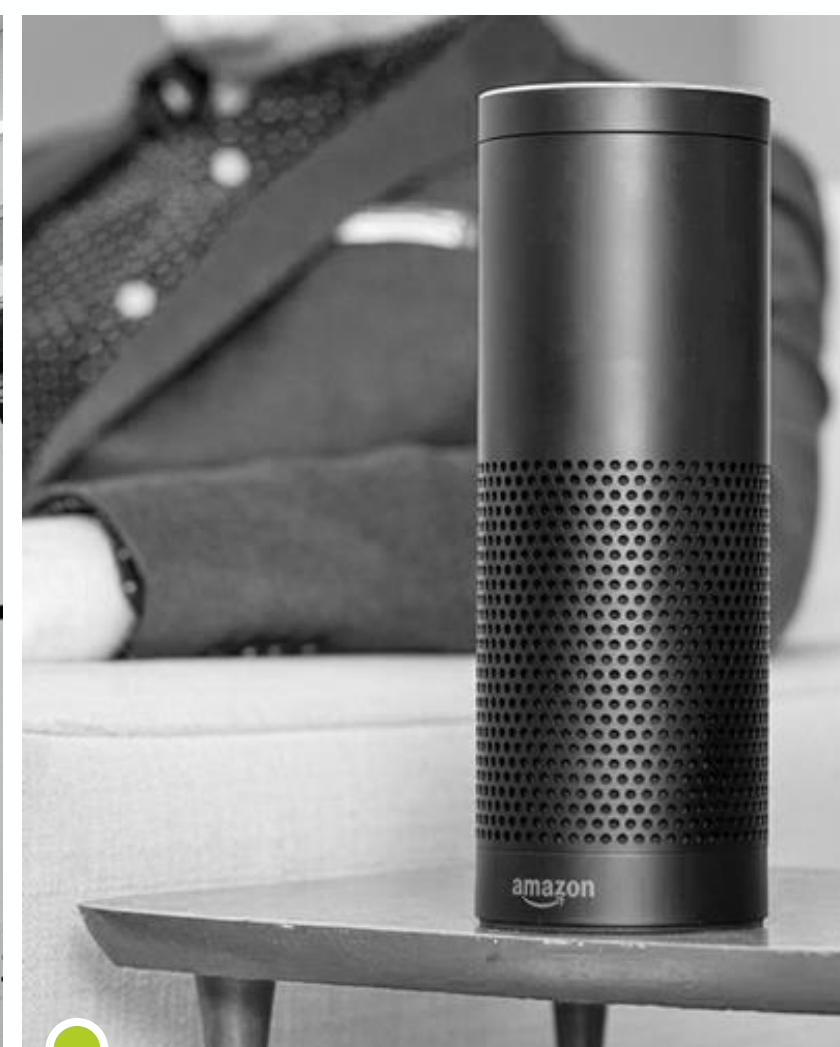
Персональные ассистенты (Siri, Alexa)