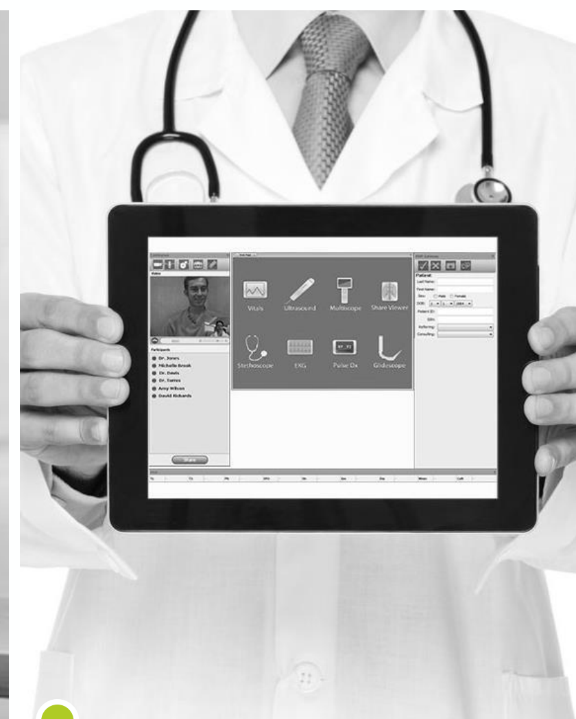
Датчики и телемедицина