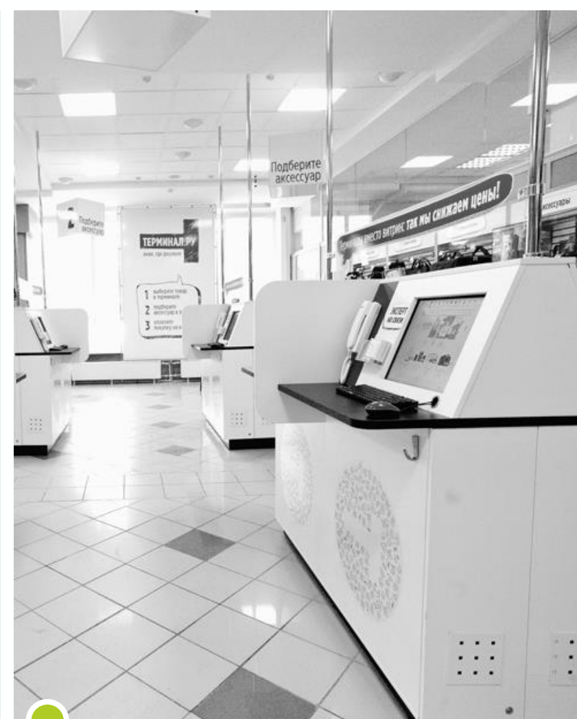
Магазины без продавцов