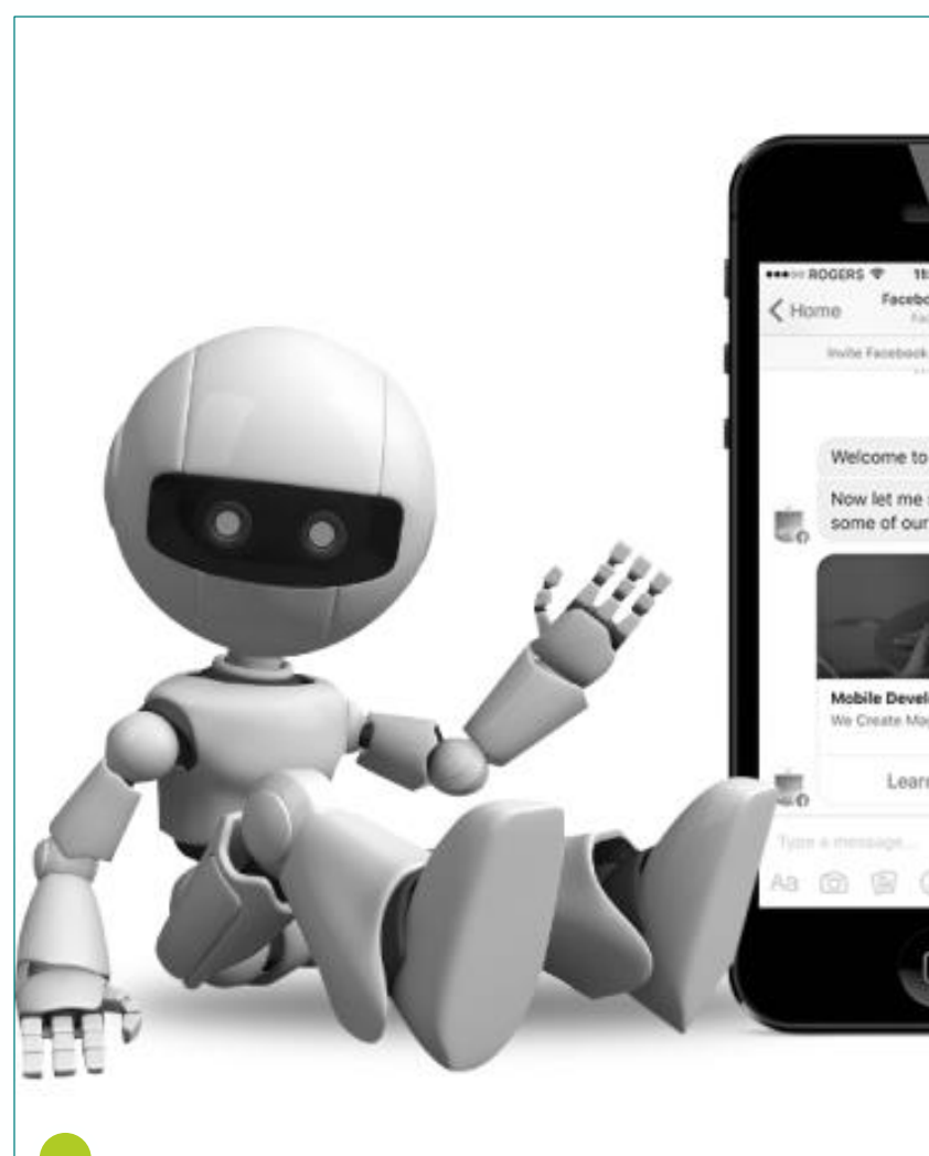
Чат-боты и системы обслуживания клиентов