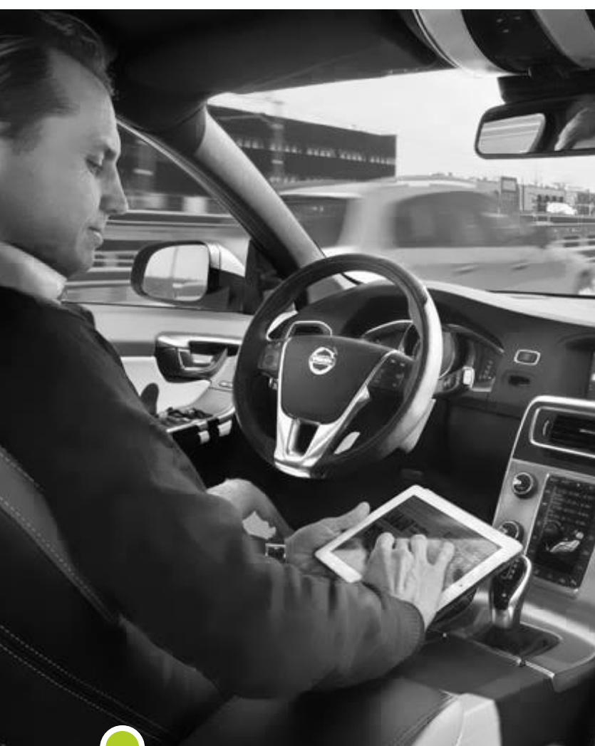
Беспилотные автомобили (Volvo, Google)