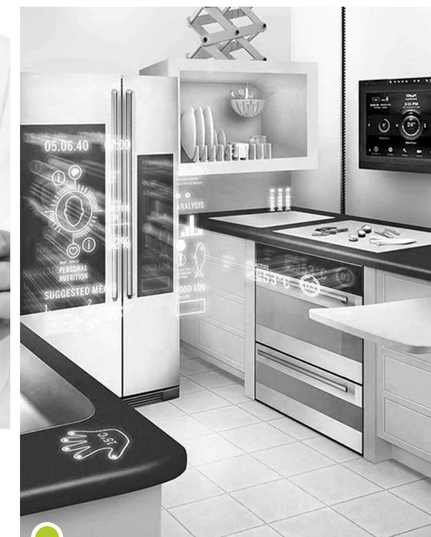
Интернет вещей (от сигнализации до зубной щетки)